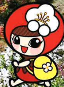
越生町のマスコット 「つめりん」