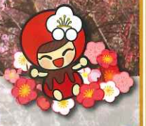
越生町のマスコット「らめりん」

おごせ 主催 越生町 一般社団法人越生町観光協会 お問い合わせ 049-292-1451